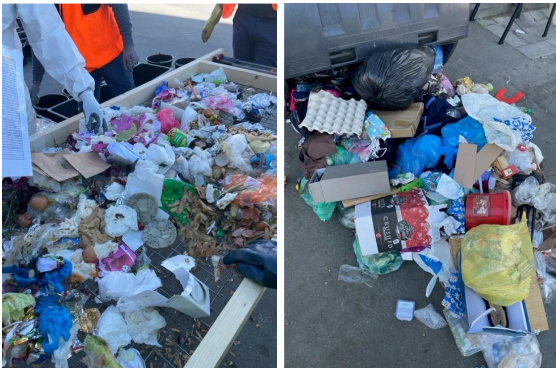
Ilustrační foto č. 3 – směsný komunální odpad vysypaný z popelářského vozu Zdroj - MPG