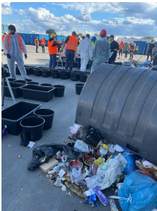
Ilustrační foto č. 4 – provádění rozboru směšného komunálního odpadu