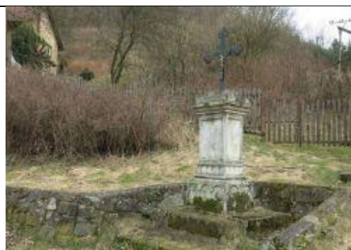
Kříž u léčebny