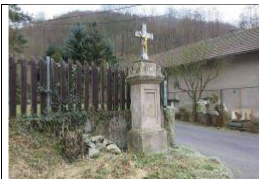
Kříž u silnice

V obci Ryjice se nacházejí dva kříže, jeden u silnice a jeden u léčebny.